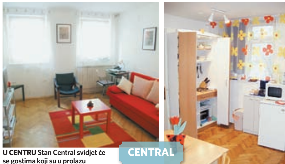
U CENTRU Stan Central svidjet će se gostima koji su u prolazu